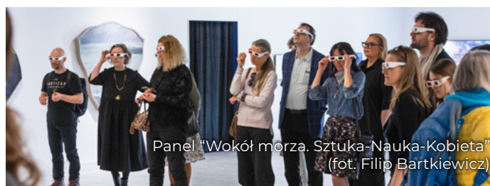
Panel „Wokół morza. Sztuka-Nauka-Kobieta”