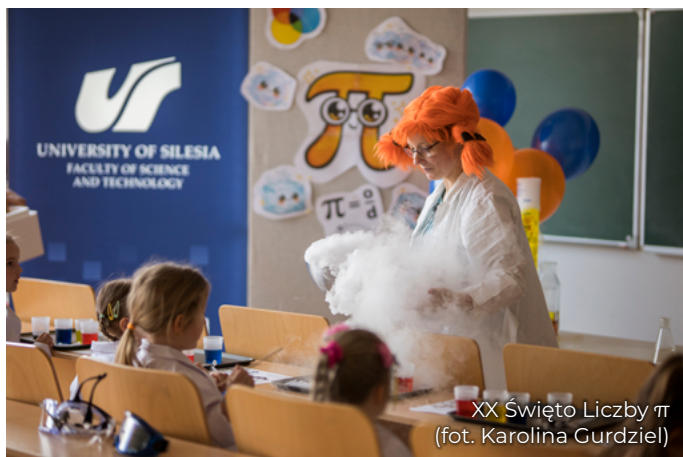
XX Święto Liczby \pi